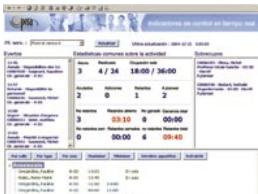
Indicadores de control en tiempo real