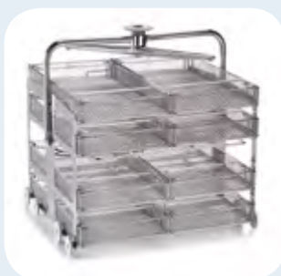
Rack 4 niveles