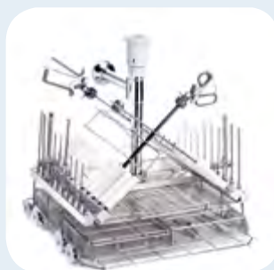
Rack instrumental MIC