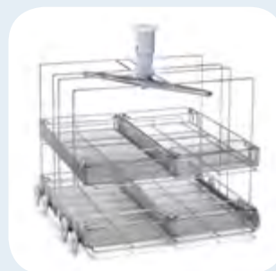
Rack 2 niveles